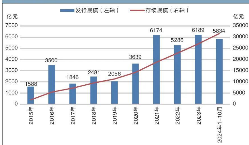
图1 2015—2024年广东债发行及存续规模

自广东省2011年首批参与地方政府自行发债试点，2014年落地我国首只自发自还的地方债以来，广东省政府债券（以下简称“广东债”）发行规模稳步增长，发行期限逐步丰富，发行成本合理可控，品种日益多元。2024年1—10月，广东债发行规模为5834亿元。截至2024年10月末，广东债累计发行3.90万亿元，存续规模为3.16万亿元 1 ，存续规模稳步提升（见图1），与广东省经济总量相匹配。