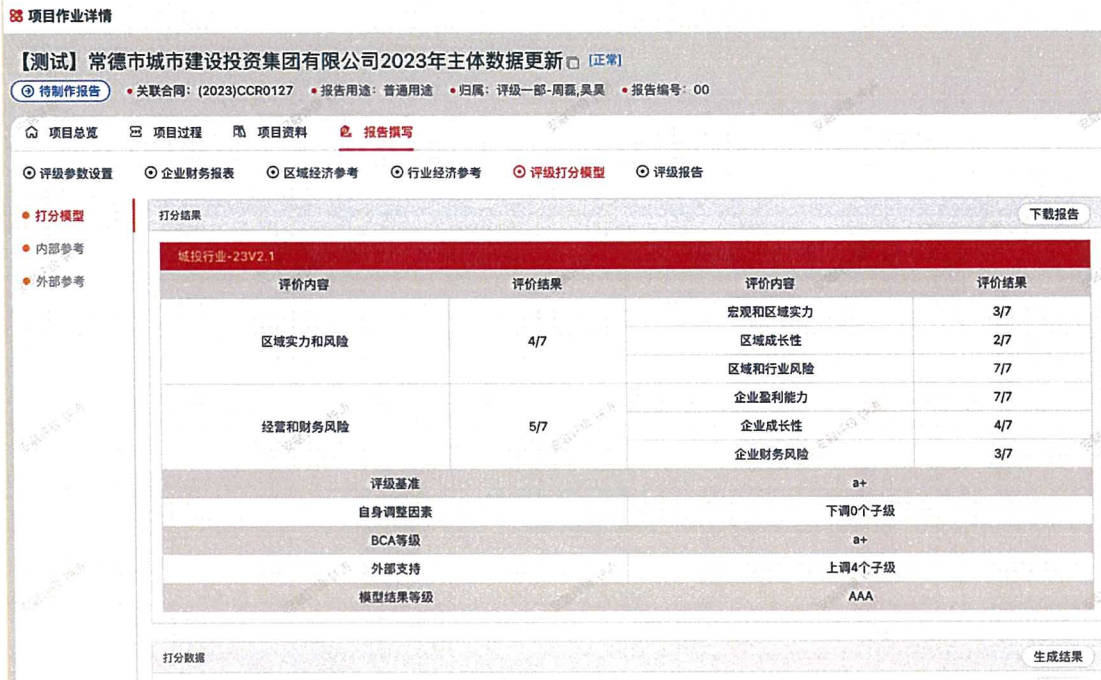
图三 评级系统 3.0 情况

为进一步加强评级系统对评级作业的支持，数据中心建设了包含标准化的嵌入式评级模型、可比企业数据库、数据索引库、风险预警监测等在内的各项实用性工具，从而对评级作业形成良好支持，极大提高作业效率。